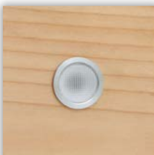
naturalny buk / jesion M-04-4000-KDR