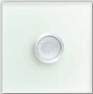
szkło matowe M-01-4000-MGL